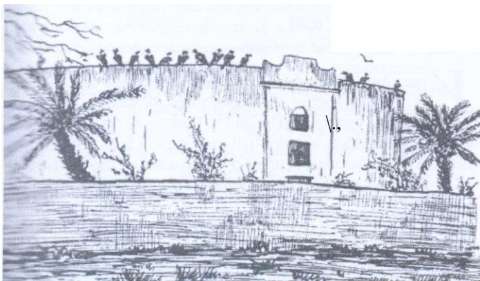
... de gieren op de Parsee begraafplaats 'de Torens der Stilte' wachtten vol ongeduld om hun lugubere opruimende taak te kunnen aanvangen...

Met een riksha lieten we ons doelloos rijden door de stad met haar drukke linkse verkeer van dubbeldekse autobussen, overvolle trammetjes, auto's en koetsjes, getrokken door aftandse paardjes die droefgeestig het hoofd lieten hangen. In de 'Hanging Gardens', een mooi park met veel bloeiende planten, aangelegd op een heuvel boven de stad, genoten we van het