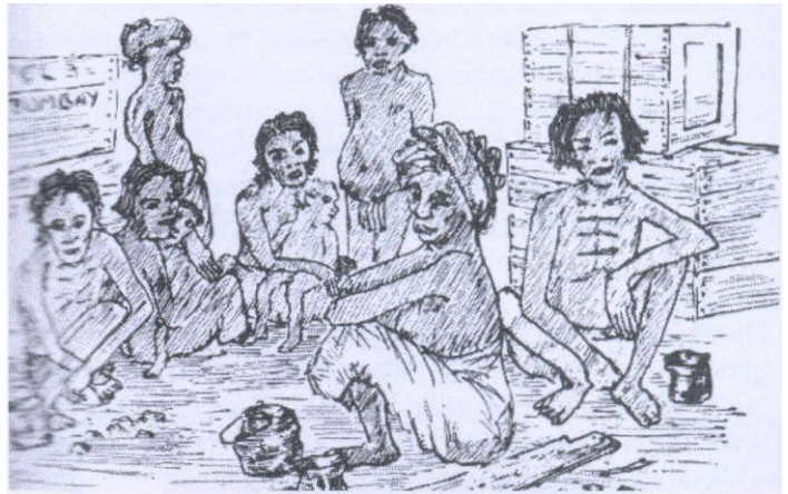
... in de schaduw van een partij kisten zat een groepje paria 's, mannen, vrouwen en kinderen, gehurkt...

In de sombere dokken van India's grootste havenstad Bombay lag het schip, waarop ik voer - temidden van vele andere vrachtvaarders onder allerlei vlag - afgemeerd langs de rommelige kade nabij de Red Gate. In de ruimen zwoegden en zweetten de donkerhuidige koelies. Op de kade zwaaiden oude, nog door waterdruk gedreven hijskranen hun ijzeren armen traag van het schip naar de wal en omgekeerd. Ondanks het nog betrekkelijk vroege uur scheen het zonnetje op deze 'kerstochtend' reeds onbarmhartig fel en blakerde de scheepsdekken en zinken daken van de opslagloodsen. Er hing een doordringende stank van opgeslagen huiden rond. Op een lichter langszij deed een moslimschipper zijn behoefte over